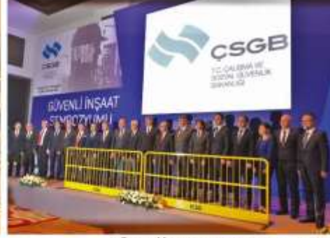
GÜVENLİ İNŞAAT SEMPOZYUMU - ADANA