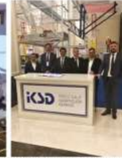
HEDEF SIFIR PRATİK ÇÖZÜMLER - İSTANBUL