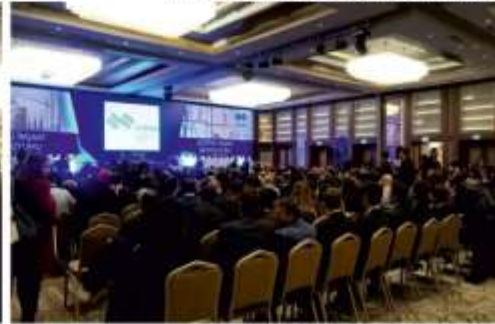
GÜVENLİ İNŞAAT SEMPOZYUMU - BURSA